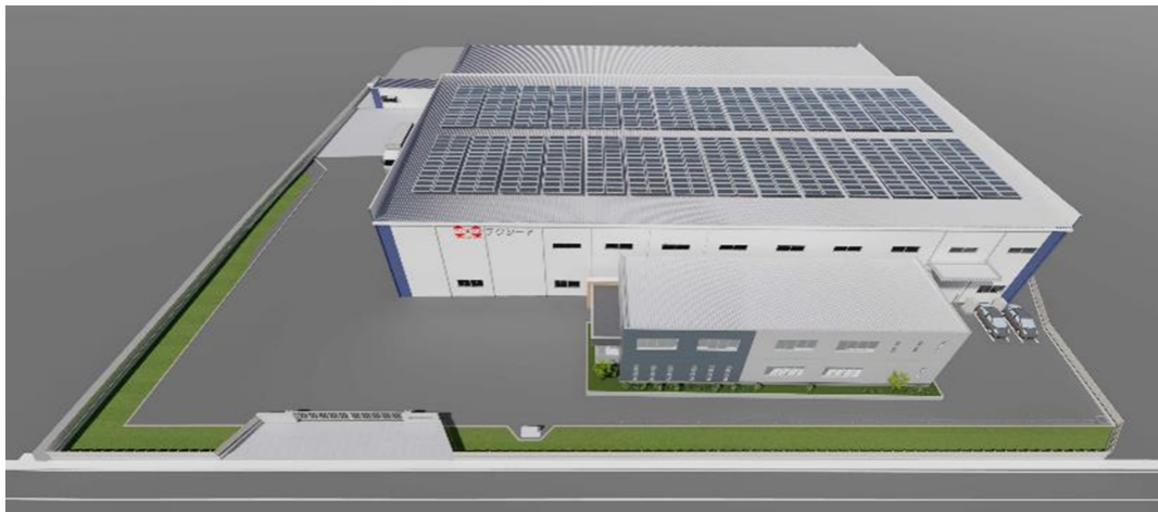
工場棟屋根に太陽光パネル設置 (発電容量200kW)